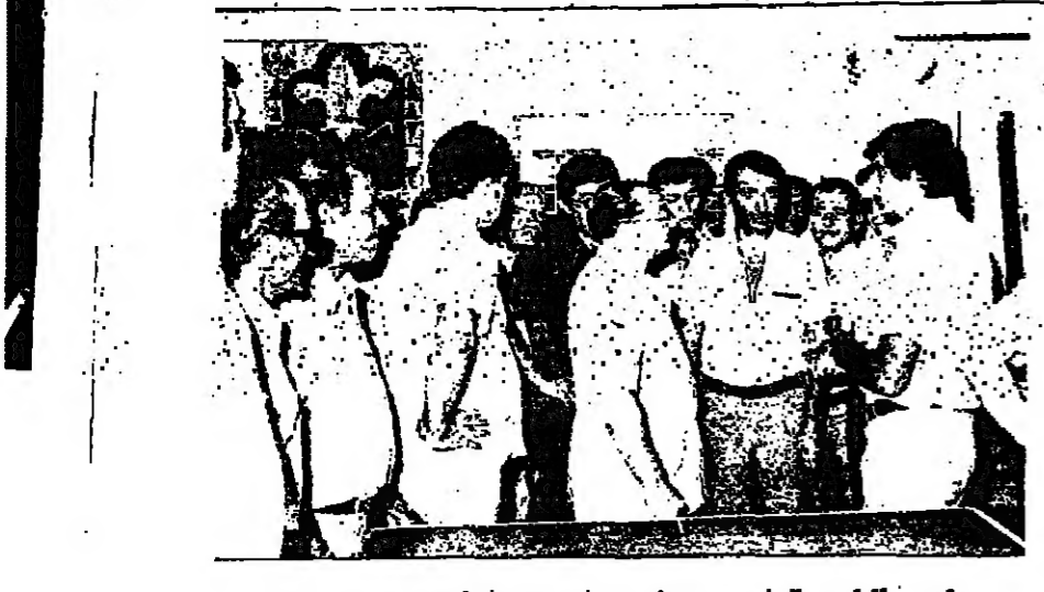
رئيس البلدية في حديث مع احد المواطنين العرب